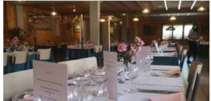
LA SALLE DU RESTAURANT