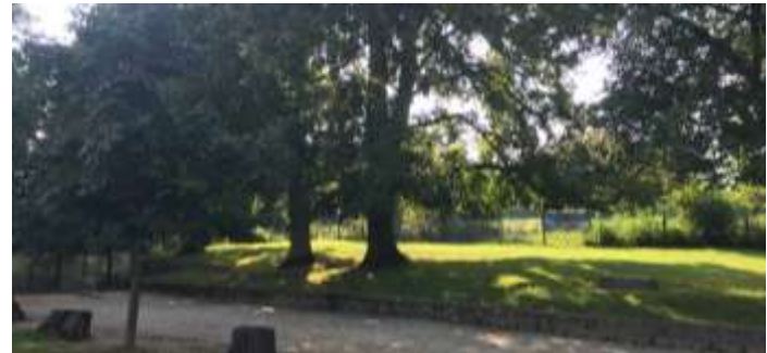
JEUX DE BOULES PRES DE LA TERRASSE