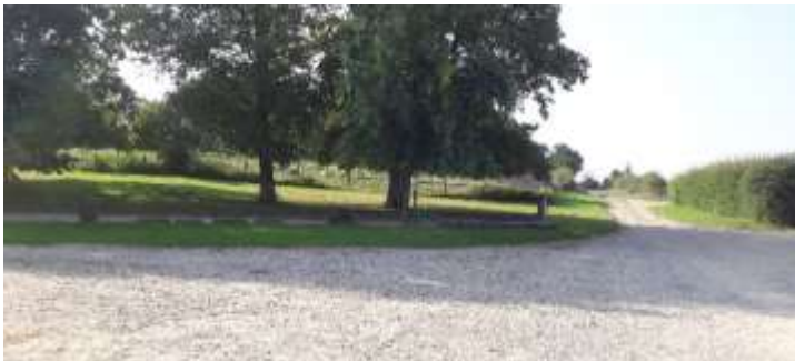
ESPACES DE STATIONNEMENT -VL ou BUS