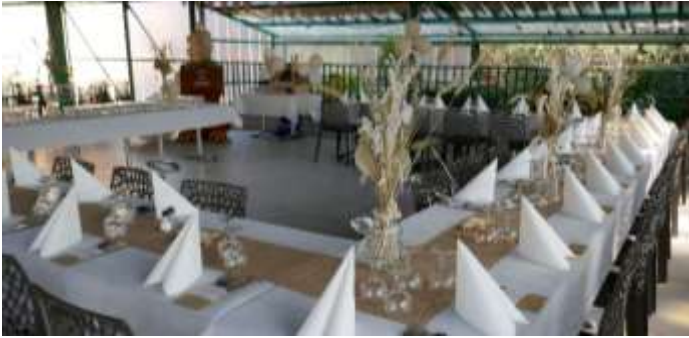
LA TERRASSE COUVERTE